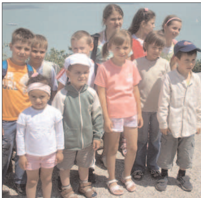
A Mátyás király úti óvoda gyermekei júniusban Siófok - Tihanyi kiránduláson vettek részt. A képen: a kirándulók csapatának néhány vidám "apraja" gyönyörködött az eléjük táruló szép tájban.